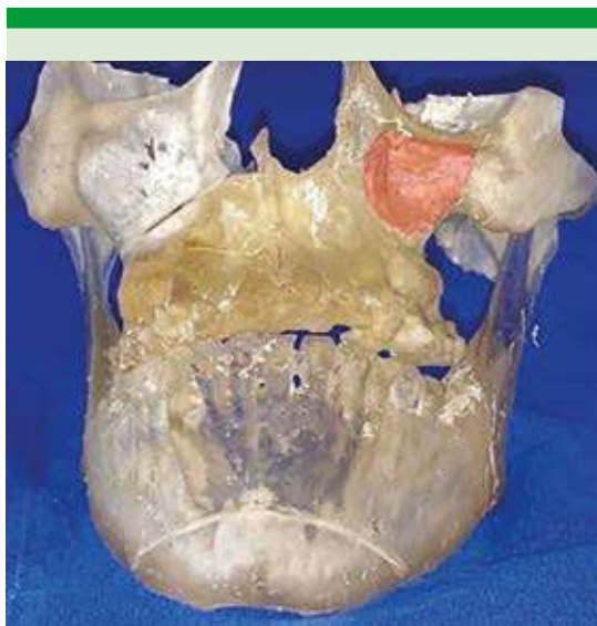
Figura 3. Estereolitografía de macizo facial que muestra la hipoplasia en la región nasomaxilar e infraorbitaria.

Bolger y colaboradores relacionan la severidad de la hipoplasia del seno maxilar con la falta de desarrollo del proceso unciforme y escasa